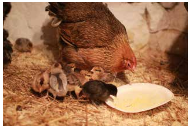
Luonnoksen tiput emonsa kanssa.

Maria on koulutukseltaan mm. hevosharrasteohjaaja, Green Care -hevostoimija ja eläinten kouluttaja sekä