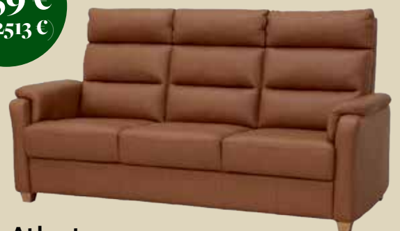
Atlanta 3h sohva nahkaverhoilulla