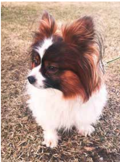
Perhoskoira Riko tykkää pureskella kesällä kuusenkäpyjä.