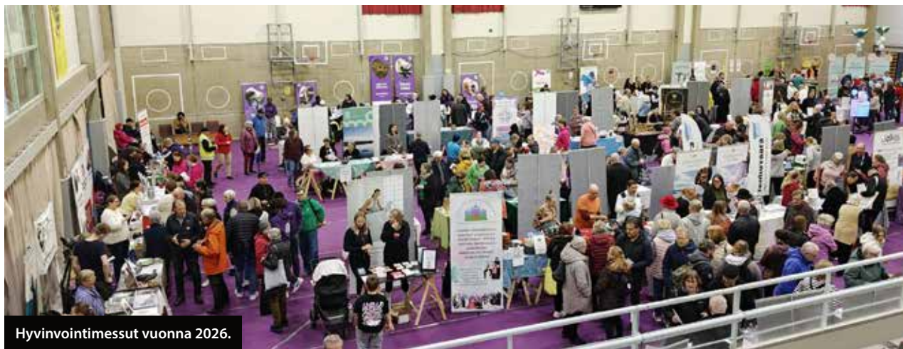
Hyvinvointimessut vuonna 2026.

HYINEN JA SATEINEN huhtikuinen sää ei haitannut messukävijöitä. Savonlinnan Liikuntahalli täyttyi iloisista näytteilleasettajista ja yli 2500 messukävijästä lauantaina