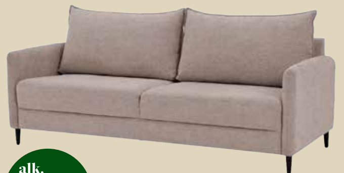
Stockholm 3h sohva.