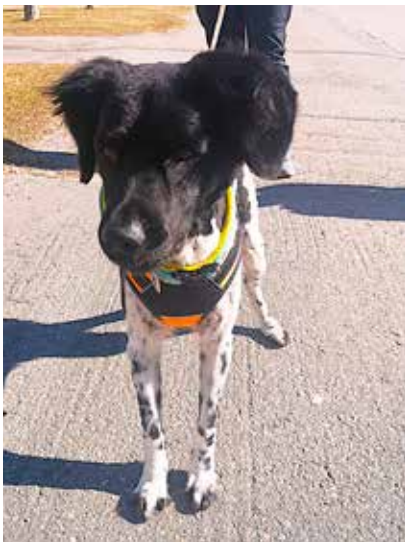
Stabijhoun Masin mielipuhuaa on uida ja juoksennella vapaana mökkimaisemissa.

Olen Masi, rodultani stabijhoun, pian seitsenvuotias seisova lintukoira ja esi-isäni ovat tulleet tänne Alankomaista. Ystävällinen, älykäs ja rauhallinen,