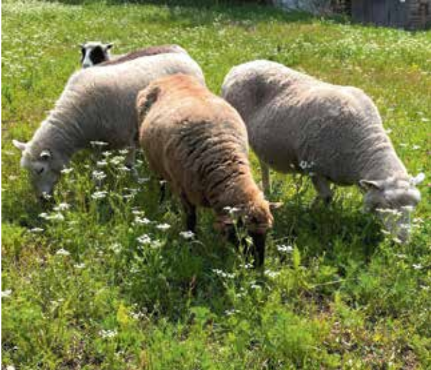
Kotimainen lampaanliha on säilyttänyt asemansa laadukkaana erikoistuotteena.

PÄÄSIÄINEN muodostaa pienenkin Suomen lampaanlihan kulutuksessa, kun useissa kodeissa valmistetaan lampaankareta tai lammasta paistia pääsiäispöytään. Vaikka lammastaloudella on Suomessa vahvat perinteet ja se liittyy tiiviisti maise-manhoitoon sekä luonnon