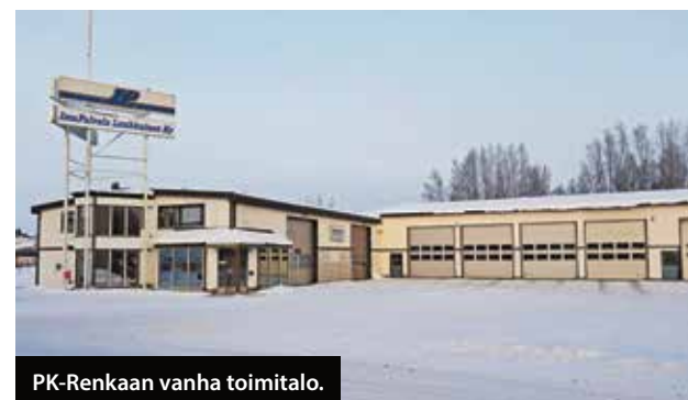
PK-Rengas vanha toimitalo.