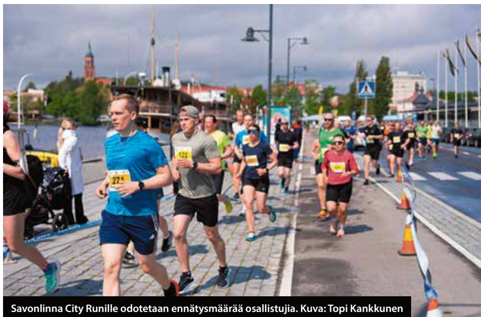
Savonlinna City Runille odotetaan ennätysmäärää osallistujia.

SAVONLINNA CITY RUN -tapahtuma järjestetään kesäkuun ensimmäisenä lauantaina 6.6. Tapahtuma on yksi hienoimmista tavoista markkinoida upeaa kaupunkiamme.