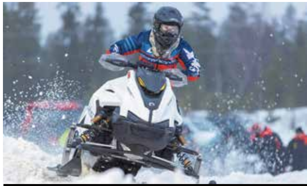
Ajaessa keskittymisen pitää pysyä fokuksessa koko ajan.