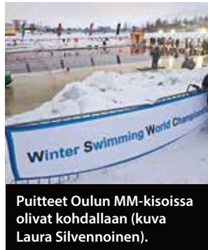
Puitteet Oulun MM-kisoissa olivat kohdallaan.

”Viime vuoden SM-kisojen jälkeen päätin ruveta treenaamaan ainakin semitoissani tämän vuoden kisoihin. Suunnittelin treenit eri tavalla ja otin myös ohjausta uintitekniikassa. Pajulahden jälkeen sisuunnuin sen verran, että viimeinen kuukausi ennen