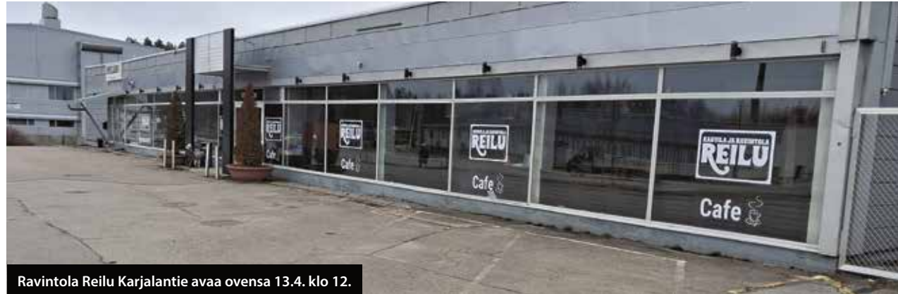
Ravintola Reilu Karjalantie avaa ovensa 13.4. klo 12.

Lounasbuffetin ytimessä on klassinen kotiruoka, jonka