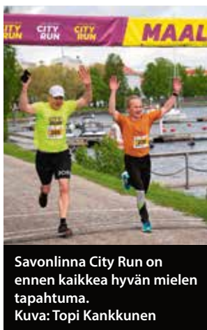
Savonlinna City Run on ennen kaikkea hyvän mielen tapahtuma.

– Osallistujat kiittelivät erityisesti järjestelyjen sujuvuutta sekä Savonlinnan ainutlaatuista miljöötä. Reitit